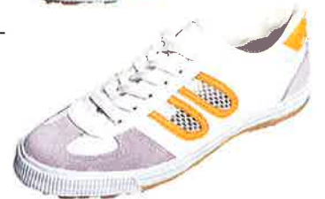
No.102 サイズ：20.0～28、29 カラー：ブルー、レッド、 グリーン、イエロー